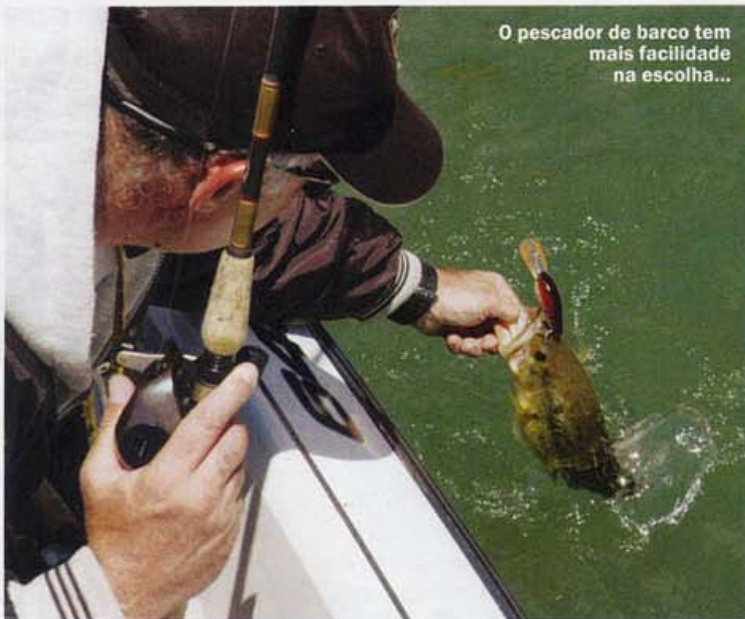
O pescador de barco tem mais facilidade na escolha...

A classificação da acção das canas e conseqüentemente a escolha por parte do pescador deve ser feita idealmente em função do diâmetro/resistência da linha e do peso da amostra que a cana foi concebida para utilizar. Esses valores, normalmente inscritos na própria cana, são normalmente muito mais fiáveis do que a classificação da acção. Uma cana classificada como de acção pesada ( Hard ) que indica como recomendação a utilização de linhas com resistências entre 16 e 30 libras (cerca de 8 a 15 quilos) e amostras entre os 3/4