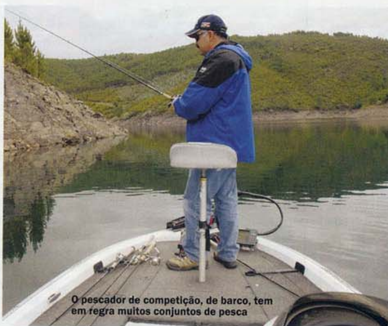
O pescador de competição, de barco, tem em regra muitos conjuntos de pesca

Para cada conjunto de técnicas ou amostras, há um tipo de equipamento ideal. As canas 'genéricas' podem ser eficientes num leque alargado de amostras e técnicas, mas nunca poderão superar a eficácia de uma cana específica